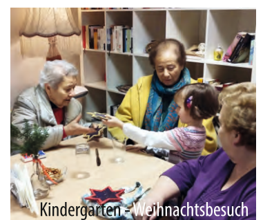
Kindergarten - Weihnachtsbesuch