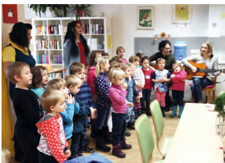
Kindergarten - Weihnachtsbesuch